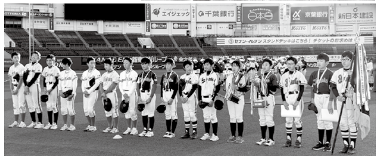
第25回大会優勝の美浜区連盟選抜チーム

■後援：千葉市・千葉市教育委員会 (株)千葉ロッテマリーンズ 習志野市少年野球連盟 佐倉市少年野球連盟佐倉支部