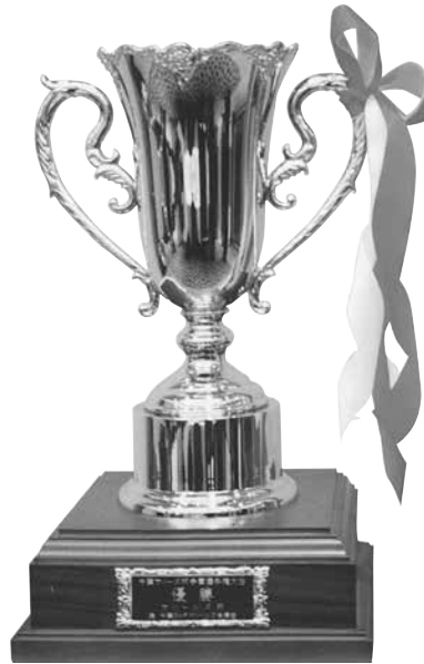
優勝 千葉マリーンズ杯