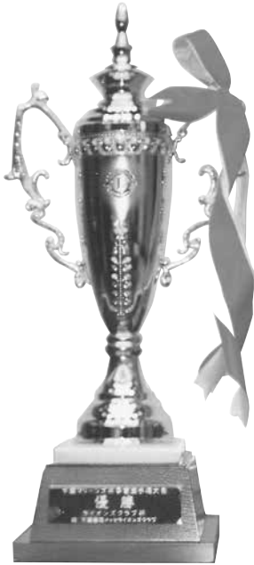
優勝 ライオンズクラブ杯