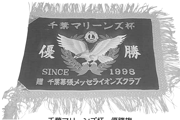
千葉マリーンズ杯 優勝旗