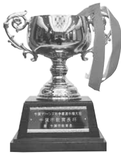
第3位 千葉市教育長杯