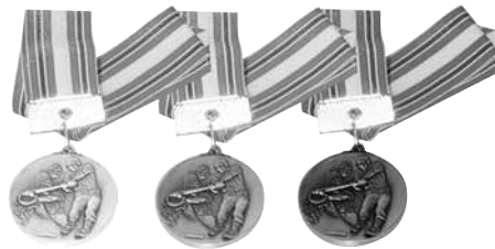
千葉マリーンズ杯出場記念メダル