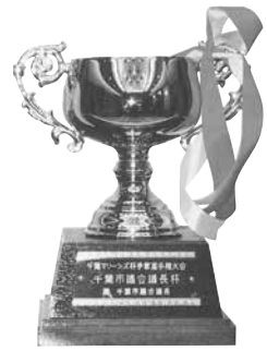
第3位 千葉市議会議長杯