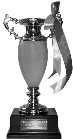
準優勝 千葉市長杯