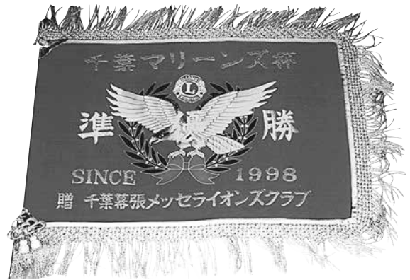
千葉マリーンズ杯 準優勝旗